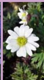
Weißes Windröschen Anemone blanda 'White Splendour'