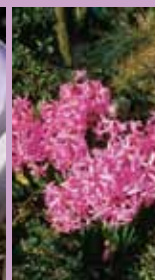
Multiflora-Hyazinthen Hyacinthus multiflora