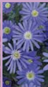
Blaues Windröschen Anemone blanda 'Blue Shades'