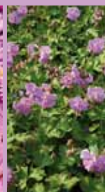
Storchschnabel Geranium x cantabrigiense 'Karmina'