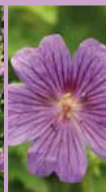
Storchschnabel Geranium x magnificentum 'Rosemoor'