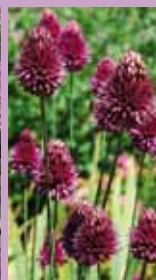
Kugelkopflauch Allium sphaerocephalon