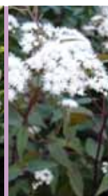
Dunkler Dost Eupatorium rugosum 'Chocolate'