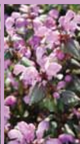
Ziest Stachys grandiflora 'Superba'