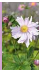
Herbst-Anemone Anemone japonica 'Königin Charlotte'