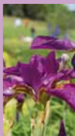
Schwertlilie Iris sibirica 'Red Flame'