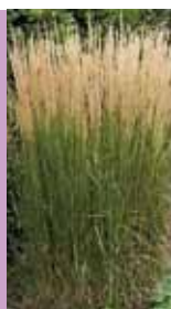
Reitgras Calamagrostis x acutiflora 'Karl Foerster'