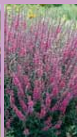
Blutweiderich Lythrum salicaria