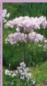
Wiesenraute Thalictrum aquilegifolium