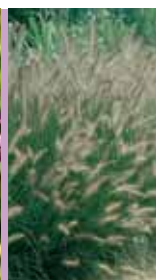
Federborstengras Pennisetum alopecuroides 'Japonicum'