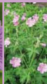
Storchschnabel Geranium x oxonianum 'Clairidge Druce'