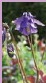
Akelei Aquilegia vulgaris