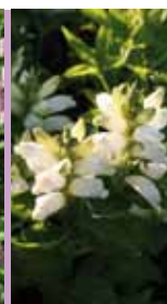
Schlangenkopf Chelone obliqua 'Alba'