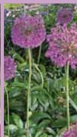
Zierlauch Allium aflatanense 'Purple Sensation'