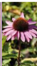
Purpursonnenhut Echinacea purpurea 'Magnus'