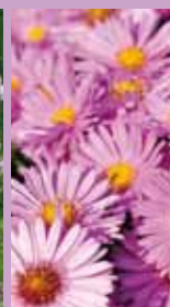
Kissen-Aster Aster dumosus 'Rosenwichtel'