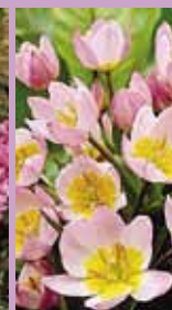
Tulpe Tulipa saxatilis 'Lilac Wonder'