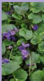
Duft-Veilchen Viola odorata 'Königin Charlotte'