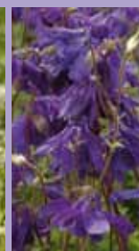
Akelei Aquilegia vulgaris