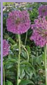
Zierlauch Allium afflatunense 'Purple Sensation'