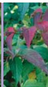
Buschgeißblatt Diervilla sessiliflora 'Dise'