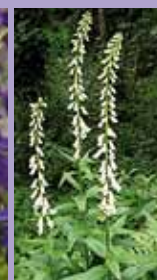
Fingerhut Digitalis lutea