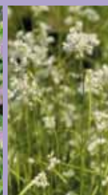
Schnee-Marbel Luzula nivea