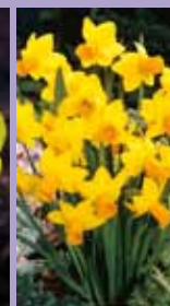
Narzisse Narcissus cyclamineus 'Jetfire'