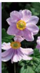
Herbst-Anemone Anemone japonica 'Serenade'