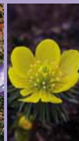
Winterling Eranthis hyemalis