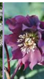
Nieswurz Helleborus x orientalis 'Frühlingsglut'