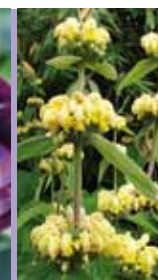
Brandkraut Phlomis russelliana