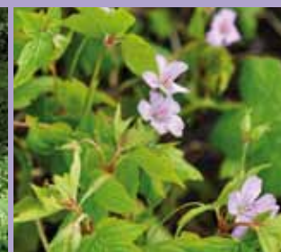
Bergwald-Storchschnabel Geranium nodosum