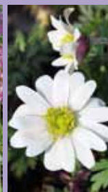
Weißes Windröschen Anemone blanda 'White Splendour'