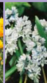
Puschkinie Puschkinia scilloides var. libanotica