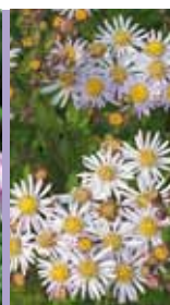
Wild-Aster Aster ageratoides 'Asran'