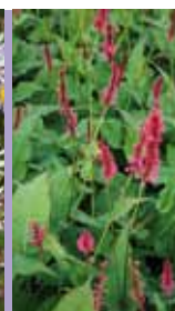
Kerzen-Knöterich Bistorta amplexicaulis 'Speciosa'