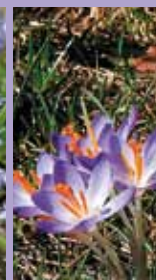
Krokus Crocus tommasinianus