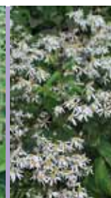
Waldaster Aster divaricatus