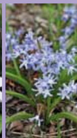
Schneestolz Chionodoxa luciliae