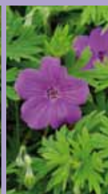
Storchschnabel Geranium sanguineum 'Tiny Monster'