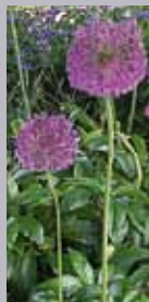
Zierlauch Allium aflatunense 'Purple Sensation'