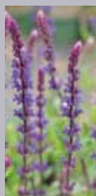
Salbei Salvia nemorosa 'Caradonna'