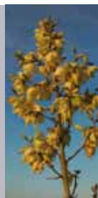
Palmilie Yucca filamentosa