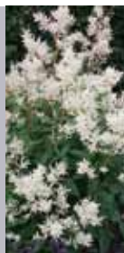
Bergknöterich Aconogonon speciosum 'Johanniswolke'