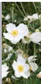
Herbst-Anemone Anemone japonica 'Honorine Jobert'