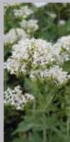
Spornblume Centranthus ruber 'Albus'