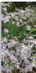
Aster Aster pyrenaicus 'Lutetia'