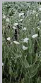
Lichtnelke Lychnis coronaria 'Alba'