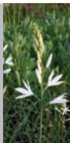
Grasilie Anthericum liliago