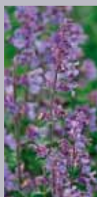
Katzenminze Nepeta x faassenii 'Walker's Low'