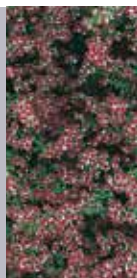
Aster Aster lateriflorus var. horizontalis