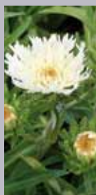
Kornblumenaster Stokesia laevis 'Mary Gregory'