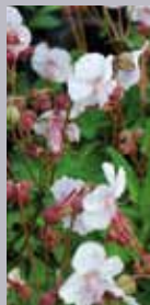
Storchschnabel Geranium macrorrhizum 'Spessart'