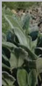
Ziest Stachys byzantina 'Silver Carpet'