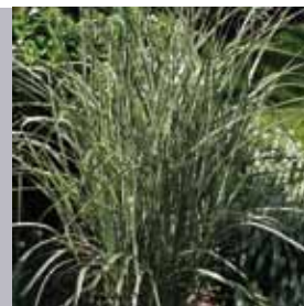
Chinaschilf Miscanthus sinensis 'Variegatus'