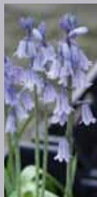
Glockenscilla Hyacinthoides hispanica