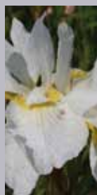
Schwertilie Iris sibirica 'Snow Queen'