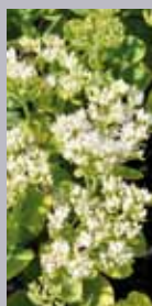
Fetthenne Sedum spectabile 'Stardust'