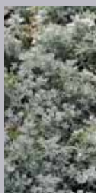
Edelraute Artemisia schmidtiana 'Nana'