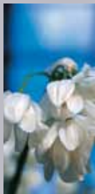
Wunderlauch Allium paradoxum var. paradoxum