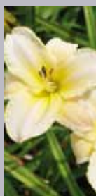
Tagilie Hemerocallis x cultorum 'Arctic Snow'