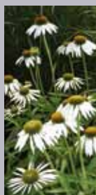
Scheinsonnenhut Echinacea purpurea 'Alba'