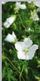
Storchschnabel Geranium sanguineum 'Album'