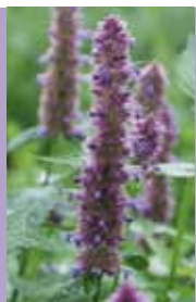
Duftnessel Agastache rugosa 'Blue Fortune'