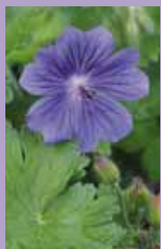
Storchnabel Geranium x magnificum 'Rosemoor'