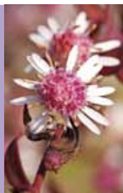
Aster Aster lateriflorus var. horizontalis 'Lady in Black'