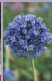
Sibirischer Lauch Allium caeruleum