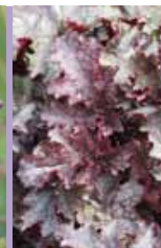
Purpurglöckchen Heuchera micrantha 'Plum Pudding'