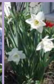
Narzisse Narcissus 'Mount Hood'