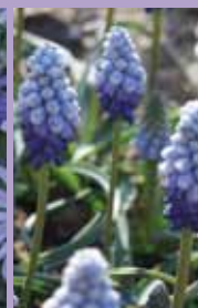
Traubenhyazinthe Muscari armeniacum 'Valerie Finnes'