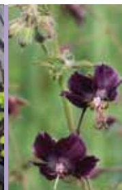
Storchnabel Geranium phaeum 'Samobor'