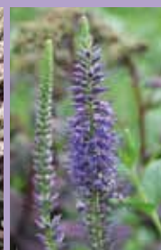
Ehrenpreis Veronica longifolia 'Blauriesin'