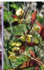
Felberich Lysimachia ciliata 'Firecracker'