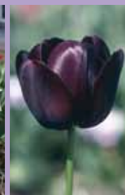
Tulpe Tulipa 'Queen of Night'