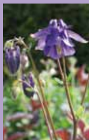
Akelei Aquilegia vulgaris