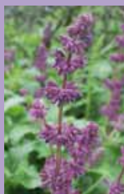
Salbei Salvia verticillata 'Purple Rain'