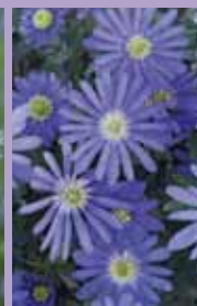
Blaues Windröschen Anemone blanda 'Blue Shades'