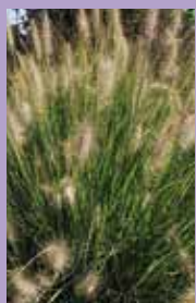
Federborstengras Pennisetum alopecuroides 'Hameln'