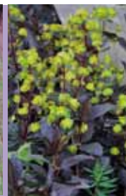
Rotblättrige Wolfsmilch Euphorbia amygdaloides 'Purpurea'