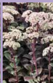
Fetthenne Sedum telephium 'Matrona'