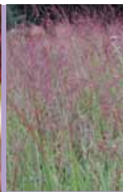
Ruten-Hirse Panicum virgatum 'Rotstrahlbusch'