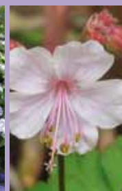
Storchnabel Geranium x cantabrigiense 'Biokovo'